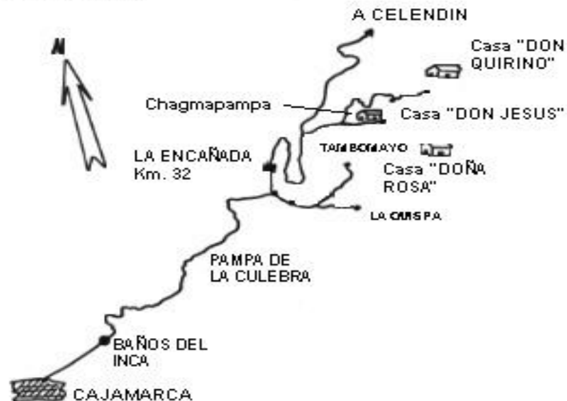
RUTA AGROTURISTICA LA ENCAÑADA

Vivencial Tours ofrece viajes a los distritos de Encañada y Namora en Cajamarca, con alojamiento en viviendas de la comunidad campesina especialmente implementadas para los turistas. Durante su visita, éstos realizan las actividades tradicionales de la comunidad, como el hilado, artesanía y labores agrícolas; participan en las festividades locales y realizan caminatas y paseos por la hermosa campiña de Cajamarca.